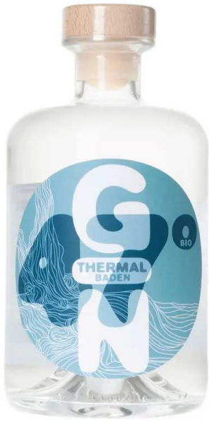
Der Gin «47° Thermal-Baden».