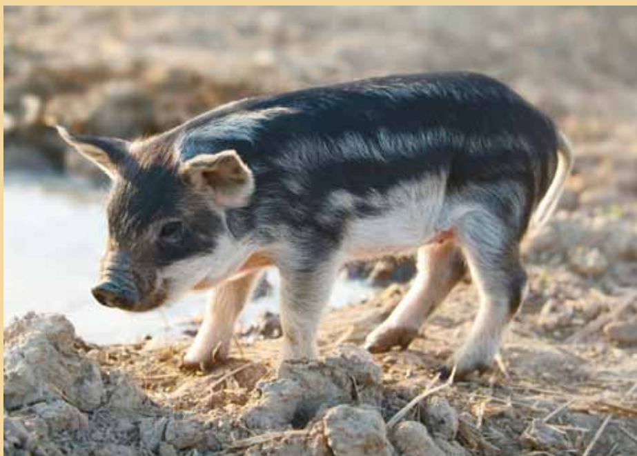
Die schönen Hinterschinken werden später mit Humbel-Kirsch massiert.

Die «Bure Kirsch»-Etikette sowie der Hochkamin mit unseren Störchen gehen auf das Gründungsjahr 1918 zurück. In all den Jahren wurden am Erscheinungsbild der Etikette keine Änderungen vorgenommen. Der «Bure Kirsch» bürgt für solide Schweizer Brenntradition. Sie hat den Kirsch-Skandal von 1945, das Echtheitszeichen und die Liberalisierungswelle von 1999 unverändert überlebt. Das Gleiche