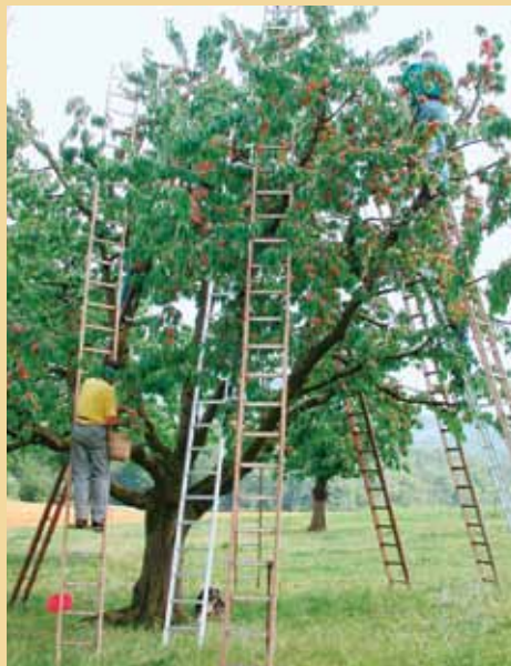
Kirschen von Hochstämmern: die Basis für den Bure Kirsch von Humbel.

Die Mangalitza-Rasse hat auch das Interesse der Vereinigung Pro Specie Rara geweckt. Sie setzt sich fortan für Schutz und Verbreitung ein. Die Schweizerische Stiftung für die kulturhistorische und genetische Vielfalt von Pflanzen und Tieren hat unter anderem bis heute über 1600 Sorten erfasst und stellt das Wissen dazu in einer Online-Datenbank zur Verfügung. ( www.prospecierara.ch ). Pro Specie Rara wird an der Humbel-Messe mit Produkten und einem Informationsstand vertreten sein. Ein Grund mehr, am Wochenende vom 14./15. November nach Stetten zu kommen. Wir freuen uns auf Ihren Besuch.