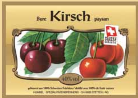
Schön seit 1918

gilt für die «Bure Zwetschge» und das «Bure Pflümli», und neu gilt dies auch für den Chrüter, den Obstbrand und den Williams. Mit Schweizer Brennkunst meinen wir unter anderem keine verwässerten Schnäpse unter 40% Vol. und selbstverständlich ausschliesslich Früchte aus